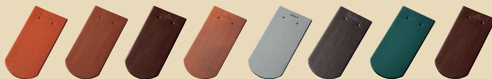
Červená Měděná Hnědá Antik Granit Černá Tmavě zelená Tmavě hnědá